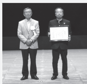
株式会社大宮ゴルフコース 様