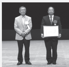
桶川市建設業協会 様