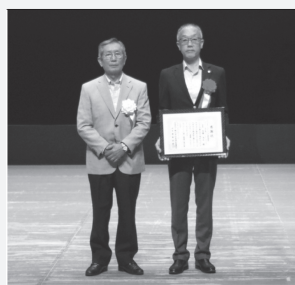
ライオンズクラブ国際協会330-C地区 桶川ライオンズクラブ 様

また、令和5年度中に桶川市社会福祉協議会に対して多大なるご寄附をいただきました方々に、おけがわ春のふれあいフェスタ開会式において、栗原会長より感謝状を贈呈いたしました。