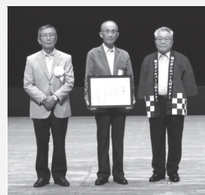
公益社団法人 桶川市シルバー人材センター 会員互助会 様