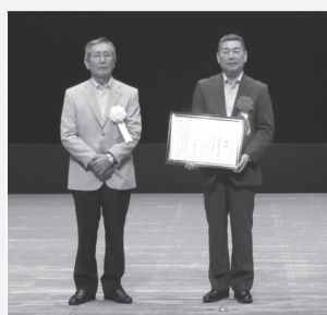
上尾遊技業組合 様