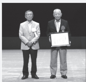
桶川市カラオケ連合会 様